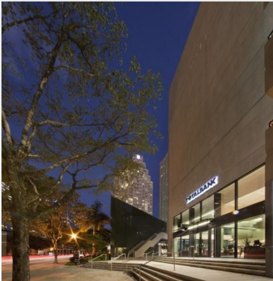
Avanza firma un contrato de digitalización con el la filial del Popular en Miami

La multinacional española Avanza ha firmado un contrato con la filial del Banco Popular en Miami , Total Bank, para la digitalización e indexación de más de un millón de documentos de dicha entidad, según ha informado la compañía, que no ha revelado el importe del proyecto.