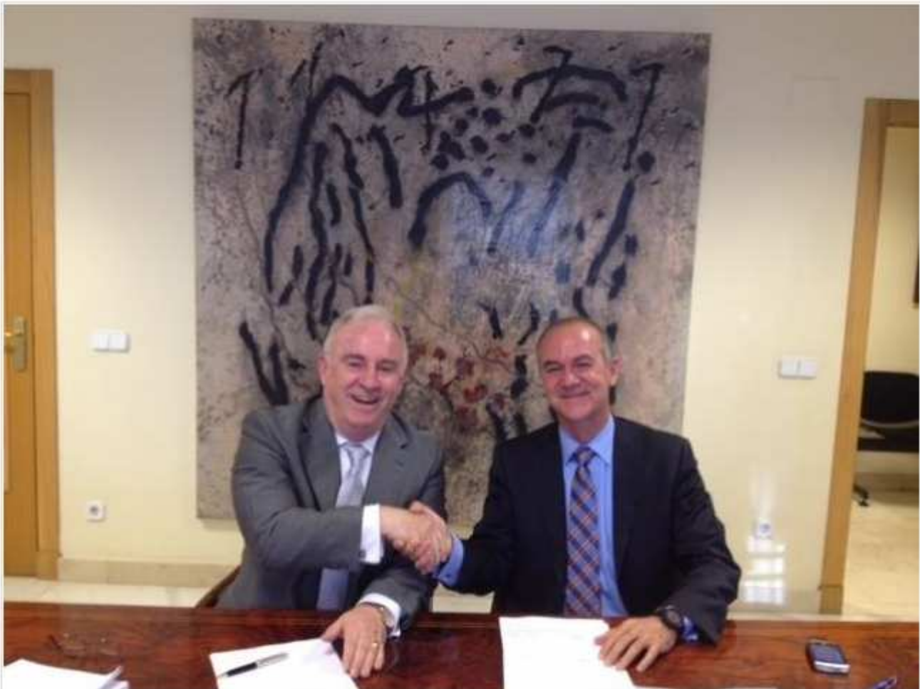
Avanza compra la firma española Agrupalia para fortalecer su negocio de 'back office' bancario

Avanza ha formalizado la compra de la empresa española especializada en la externalización de procesos de 'back office' bancario Agrupalia, según ha informado la compañía, que no precisó el importe de la operación.